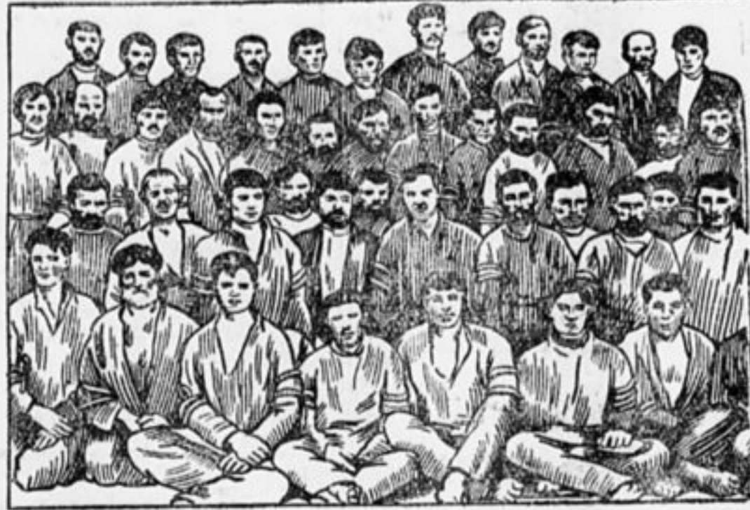
Группа бессарабских крестьян, перевязанных веревками — перед судом.

явил, не был пропущен в Кишинев, так как власти боялись защиты. Во всех странах мира все трудящиеся возмущены этим процессом 500, как и другими процессами, как и другими зверствами буржуазии. Все ученые и писатели Австрии и Германии протестуют против этих «судов». Пролетарские организации при-