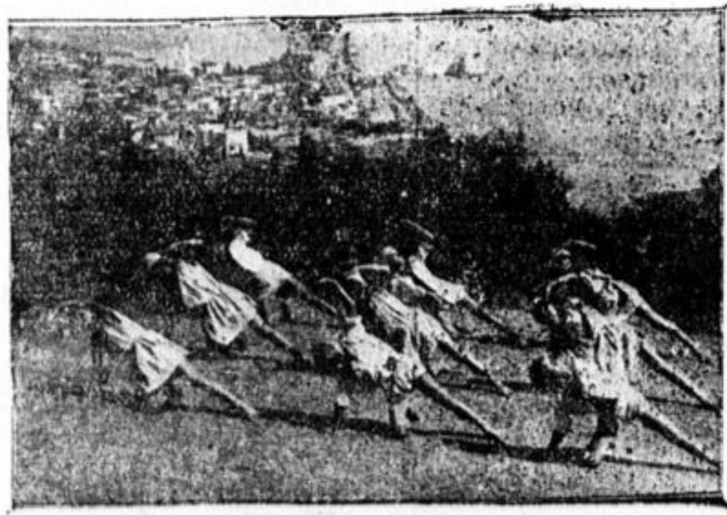
Дети Самарских крестьян на курорте Ай-Данилия в Крыму. Занимаются физкультурой.